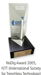
NoDig Award 2005, ISTT (International Society for Trenchless Technology)

Telefon: +49 234 5167-110 Fax: +49 234 5167-109 E-Mail: info@unitracc.de Internet: http://www.knowledge-factory.de