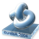
eureleA 2004, the European e-Learning award